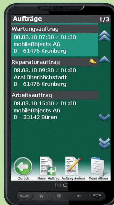
Endgerät für mobilen Kundenservice HTC HD2

Das Zusatzmodul mO – mobiler Kundenservice ermöglicht Ihnen und Ihren Mitarbeitern mit Hilfe spezieller Handys auch unterwegs auf Stammdaten und Aufträge im HWP zuzugreifen. Die Mitarbeiter können optimal gesteuert werden und sich per Navigationssoftware zum Kunden leiten lassen. Arbeiten lassen sich vor Ort dokumentieren, vom Kunden abzeichnen und per Knopfdruck an die Zentrale weiter leiten zwecks Rechnungsstellung.